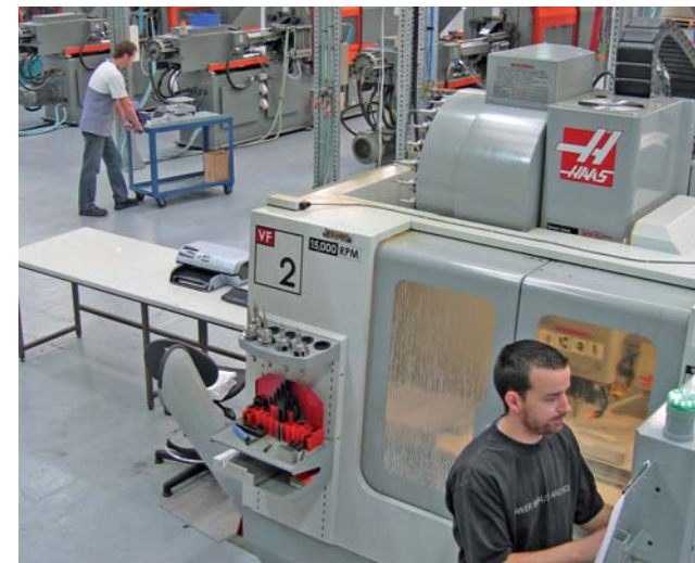
Hier wird gearbeitet: Der Fertigungsbereich von Protomold.

ren konnten.“ Lange war so beeindruckt, dass Noise Limit den Service von Protomold während der Entwicklung von SilentFlux mehrmals in Anspruch nahm.